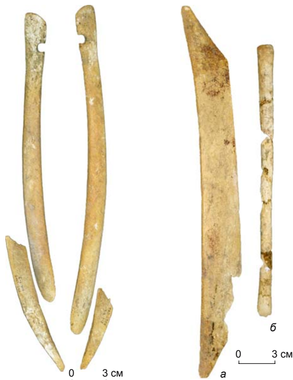
Рис. 5. Составные концевые накладывы на верхний конец кибиты. Уч-Курбу, объект № 1, погр. 9.

По форме и расположению накладок все луки с памятника Уч-Курбу можно отнести к одному типу – с концевыми, срединными боковыми и фронтальной накладками (рис. 8). Особенности оформления накладок на верхний конец кибиты из погребений 9 и 10 позволяют выделить вариант этого типа – с составными концевыми накладками. Луки с концевыми, срединными боковыми и фронтальной накладками были широко распространены на всей территории степного пояса Евразии в течение первой половины I тыс. н.э. [Хазанов, 1971, с. 30; Худяков, 1985, с. 46; Худяков, 1986, с. 26–30; Кожомбердиев, Худяков, 1987, с. 78]. Судя по размерам концевых накладок, все тосорские луки асимметричные. У них верхнее плечо кибиты заметно длиннее нижнего. В некоторых случаях изготовители луков не могли подобрать роговую заготовку нужной длины, поэтому делали накладки на более длинный верхний конец составными. Ве-