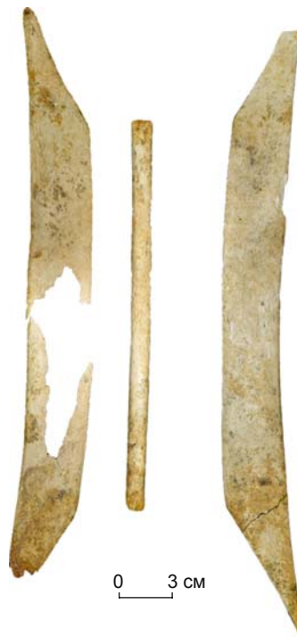
Рис. 3. Срединные боковые и фронтальная накладки лука. Уч-Курбу, объект № 1, погр. 6.