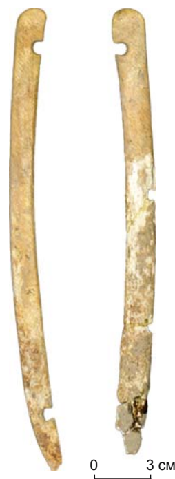
Рис. 7. Концевые накладки на нижний конец кибиты. Уч-Курбу, объект № 1, погр. 9.