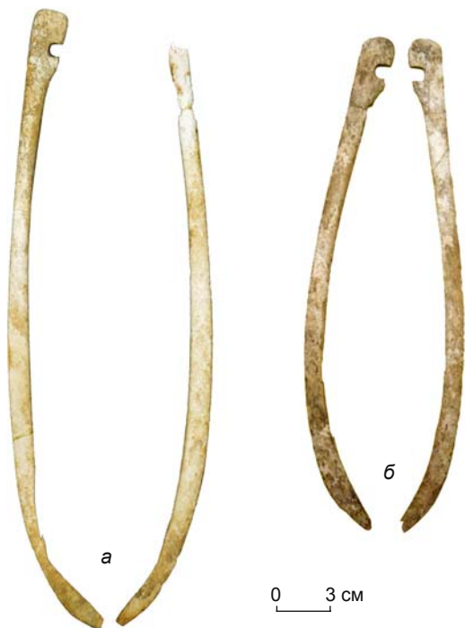
Рис. 2. Концевые накладки на верхний (а) и нижний (б) концы кибити. Уч-Курбу, объект № 1, погр. 6.